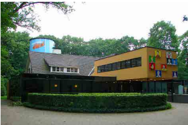
Suske en Wiske museum te Kalmthout